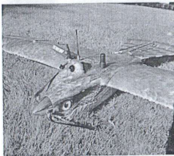
Рис. № 2