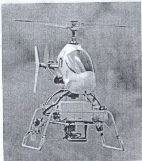
Рис. № 1