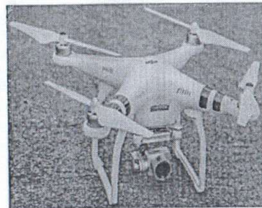
Рис. № 6