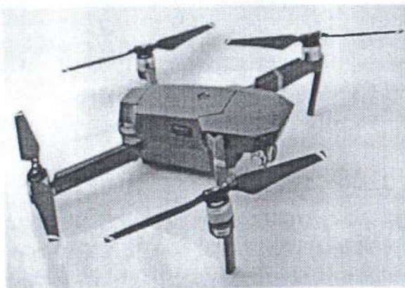
Рис. № 5