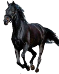
a h__ _se