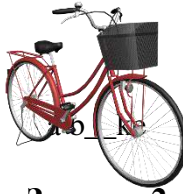
a b__ _ ke