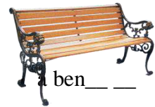
a ben__ _

Прочитай слова и вычеркни одно «лишнее» слово в каждой строчке.