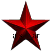
a s__ _ ar