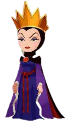
a qu__ _ n